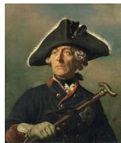
Friedrich der Große